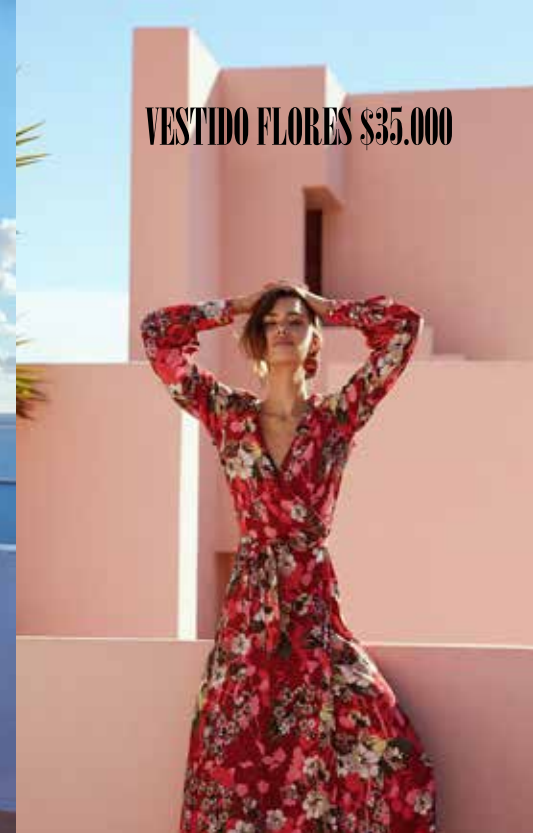
VESTIDO FLORES $35.000