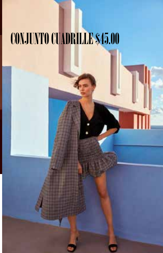
CONJUNTO CUADRILLE $45.00

Wallcandy recibió el encargo de dirigir de forma creativa la campaña de moda para MLM. Nuestro objetivo era salu- dar el ambiente relajado, moderno y vanguardista de la marca en el contexto de uno de los destinos más famosos de España. Encaramado en los acantilados rocosos de Calpe en la región de Alicante de España se encuentra La Muralla Roja. Diseñada por el arquitecto español Ricardo Bofill, la estructura similar a una fortaleza encarna frescura y vita- lidad, como una generosa losa de delicioso helado que se eleva desde las aguas turquesas y brillantes del Mediterráneo. Es un festín para los sentidos, un Jardín del Edén junto al mar rodeado de naranjos cargados de fruta madura, que libera toques cítricos y notas brillan- tes, efervescentes y optimistas.